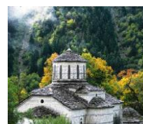
Η πρόσφατα ανακαινισμένη Ι.Μ. Μεταμορφώσεως του Σωτήρος στο Χαλίκι

3. Τελευταίο στη διαδρομή, και το πιο απομακρυσμένο από τα Τρίκαλα, είναι το παραδοσιακό και διατηρητέο Χαλίκι . Στην ολόδροση πλατεία του (ύψος 1.240 μ.) βρίσκεται η τρισυπόστατη τρίκλιτη βασιλική της Αγίας Παρασκευής ίσως η σημαντικότερη, και πάντως πιο αρχοντική, από τις οκτώ του χωριού αλλά και ολόκληρων των ορεινών Τρικάλων. Ο προσεκτικός ταξιδιώτης θα προσέξει στον εξωτερικό τοίχο του ιερού τα λιθανάγλυφα σταυρών διαφορετικών θρησκειών και πεντάλφα (αστέρι του Δαυίδ), που η παράδοσή μας διασώζει ότι αποτρέπουν το κακό. Απέναντι από το χωριό είναι το παλιό μοναστήρι του Αγίου Γεωργίου, ενώ κάτω από την πλατεία υπάρχουν δύο πανέμορφα πέτρινα γεφύρια της «Καπραλιάς» και του «Χαλικιού ή Άσπρου». Περπατώντας ή συζητώντας με τους ντόπιους στις πλατείες των χωριών θα διαπιστώσετε και εσείς τις αμέτρητες χάρες που κρύβονται εδώ. Σε τόσο μικρό γεωγραφικό χώρο συνωσιάζονται δεκάδες θρησκευτικά μνημεία, πέτρινα γεφύρια, αρχοντικά και κρήνες οδηγώντας σας σιγά-σιγά να συνειδητοποιήσετε την ιστορία και την πολιτιστική αξία του τόπου.