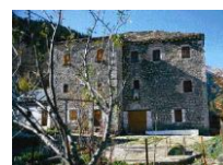
Το αρχοντικό Παπαστεργίου απέναντι από την πλατεία της Ανθούσας