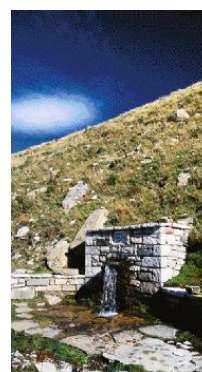
Η αλπική βρύση Γραίκου

ΧΑΛΙΚΙ: Την πρόσφατα ανακαινισμένη Μονή Μεταμορφώσεως του Σωτήρος με τον τρούλλο, και το μικρότερο κτίσμα της Μονής Προφήτη Ηλία. Πραγματοποιήστε τις δύο διαδρομές από το Χαλίκι προς τη Ρόνα και τη Βουρτόπα (προς Μέτσοβο) αλλά και την όχι άδικα διάσημη Δρακολίμνη της Βερλίγκας ή Βρίγγας (προς το βουνό Περιστερί). Είναι βέβαιο ότι θα σας προσδώσουν μian άλλη διάσταση για τον τόπο.